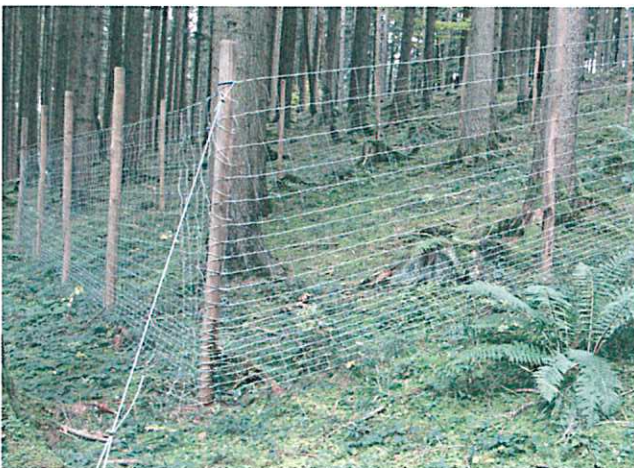
Der Zaun muss Schalenwild zuverlässig und dauerhaft abhalten können.

Das Flächenpaar sollte mindestens 10 bis 20 Meter auseinander liegen und an Hängen hangparallel ausgerichtet sein. Zu angrenzenden, nicht verjüngten oder zur Verjüngung anstehenden Bereichen ist ein Abstand von mindestens 5 Metern einzuhalten.