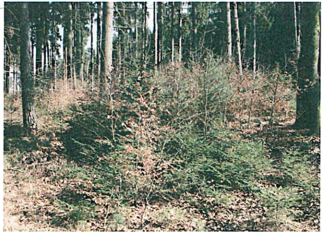
Naturnah und standortgemäße Verjüngung für den Wald von morgen

Um die Wälder im Wesentlichen ohne Schutzmaßnahmen möglichst naturnah und standortgemäß zu verjüngen, ist eine gute Zusammenarbeit zwischen Waldbesitzern, Jagdgenossenschaften und Jägern notwendig. Die Anlage von Weiserflächen und ihre Einbeziehung in regelmäßige gemeinsame Revierbegänge sind hervorragend geeignet, die Zusammenarbeit auf Revierebene zu stärken. Die Ergebnisse der Weiserflächen müssen für alle Beteiligten transparent und nachvollziehbar sein.