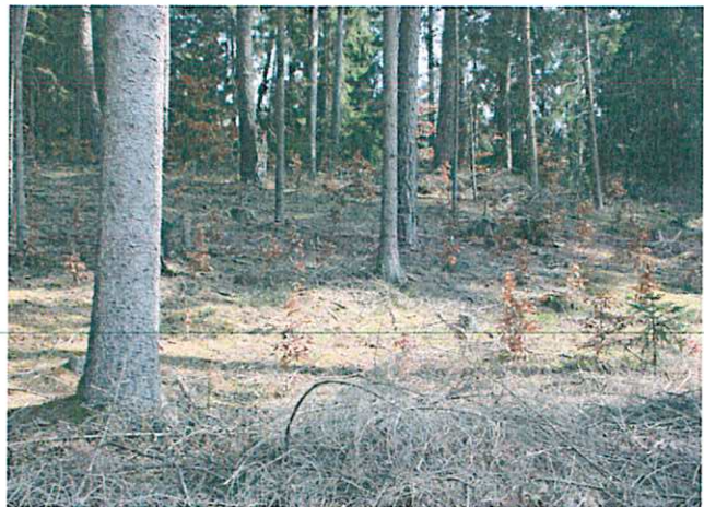
Bei der Anlage der Weiserflächen muss man auf möglichst ähnliche Ausgangsbedingungen für die Verjüngung achten.