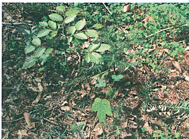
Ob eine standortgemäße Naturverjüngung ohne Schutzmaßnahmen möglich ist, kann mit Hilfe von Weiserflächen beurteilt werden.

zes sowie in Art. 32 BayJG und der dazugehörigen Ausführungsverordnung geregelt ist